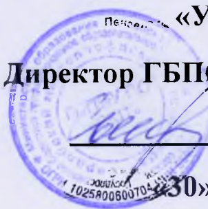
График технического обслуживания хоккейной площадки на декабрь 2017 года